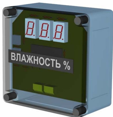
Рис. 1. Внешний вид блока индикации