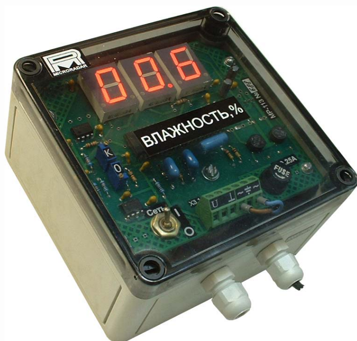
Рис. 1. Внешний вид блока индикации