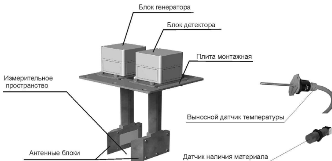
Рис. 4.1. Внешний вид блока сенсоров.

По конструкции антенные блоки генератора и детектора идентичны, антенный блок генератора имеет встроенный датчик температуры. Антенные блоки генератора и детектора представляют собой полосковые антенны, герметично защищенные радиопрозрачным материалом. В рабочем режиме антенны погружены в контролируемый материал. Пространство между антеннами называется измерительным пространством .