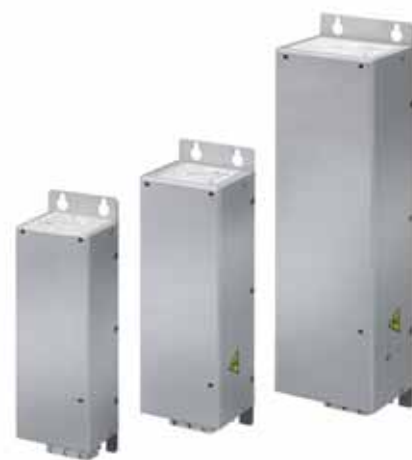
Типоразмеры 3 различных типоразмера линейных фильтров соответствуют исполнениям M1, M2 и M3 VLT® Micro Drive.